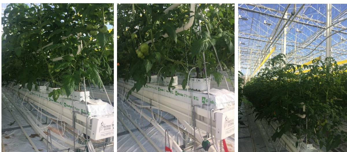
Figuur 1: Verschillende opstellingen met alternatieve plaatsing van het LT-net onder de teeltgoot (links), in de stengelbeugels (midden) en tussen de planten (rechts). Opmerking: de foto's werden in het begin van de teelt genomen waardoor de buizen in de rechtse foto nog boven de planten hangen i.p.v. ertussen.

Op verschillende hoogtes in de serre werden ook temperatuursensoren geplaatst om de temperatuurverdeling in kaart te brengen.